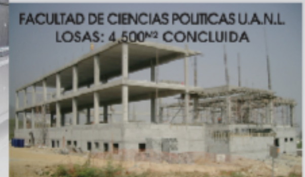
FACULTAD DE CIENCIAS POLITICAS U.A.N.L. LOSAS: 4,500 M2 CONCLUIDA