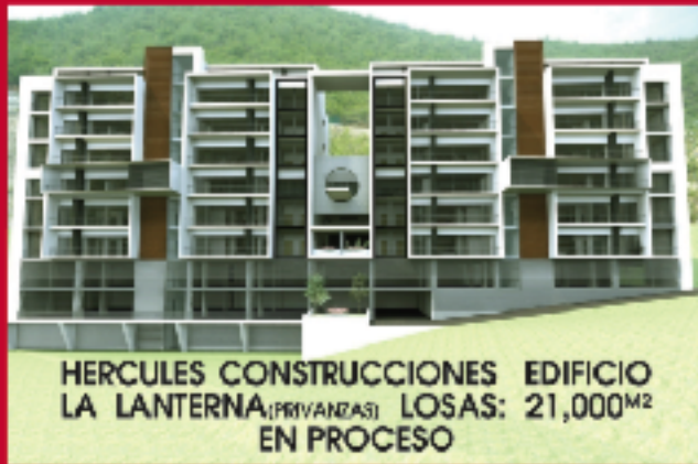
HERCULES CONSTRUCCIONES EDIFICIO LA LANTERNA (PRIVANZAS) LOSAS: 21,000 M2 EN PROCESO