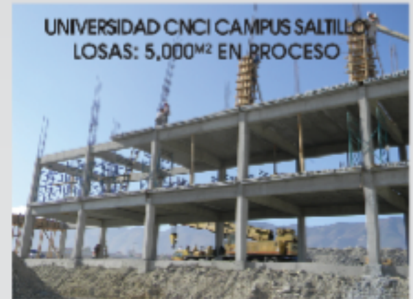
UNIVERSIDAD CNCI CAMPUS SALTILLO LOSAS: 5,000 M2 EN PROCESO