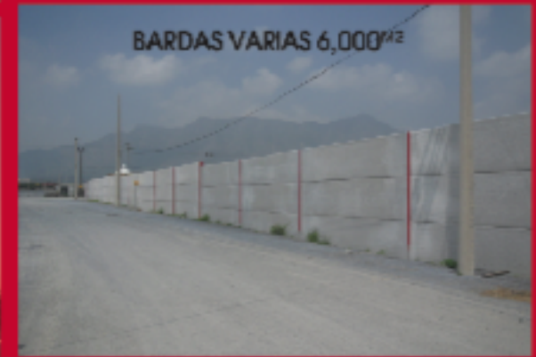
BARDAS VARIAS 6,000 M2

"NUESTRO DESAFIO ES CAMBIAR LA MENTALIDAD DE LOS DISEÑADORES ESTRUCTURALES, INGENIEROS, CONSULTORES, ARQUITECTOS, ETC., QUE ASESORAN A LA INDUSTRIA DE LA CONSTRUCCION. CREEMOS QUE ESTO SERA POSIBLE MEDIANTE LA CREACION DE UNA CONCIENCIA COLECTIVA DEL PRODUCTO Y ATENDIENDO A LAS PREOCUPACIONES DE LOS CONSTRUCTORES"