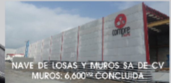
NAVE DE LOSAS Y MUROS SA DE CV MUROS: 6,600 M2 CONCLUIDA