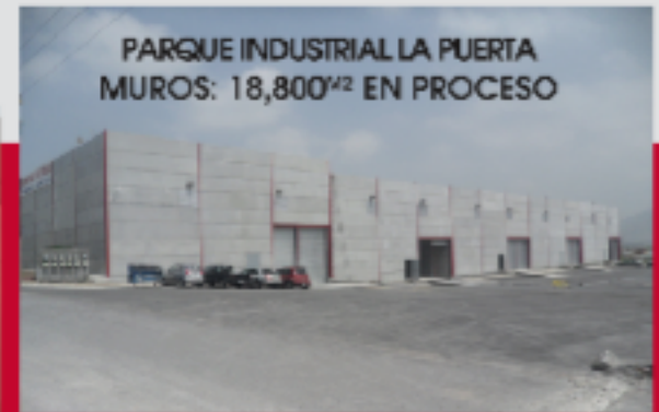
PARQUE INDUSTRIAL LA PUERTA MUROS: 18,800 M2 EN PROCESO