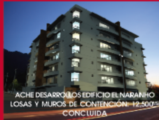
ACHE DESARROLLOS EDIFICIO EL NARANJO LOSAS Y MUROS DE CONTENCIÓN: 12,500 M2 CONCLUIDA