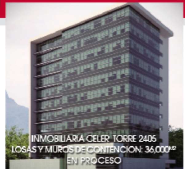
INMOBILIARIA CELER TORRE 2405 LOSAS Y MUROS DE CONTENCIÓN: 36,000 M2 EN PROCESO